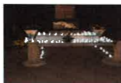
La veillée du 10 Novembre 2018

la commune a rendu hommage à ses anciens combattants, après la remise de gerbe par l'association des anciens combattants et la lecture du message du président de la république, nous sommes allés saluer les anciens combattants au cimetière.