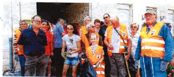
Petits et grands motivés.