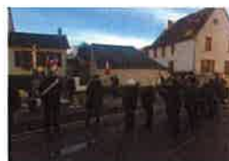
Le 11 Novembre 2018