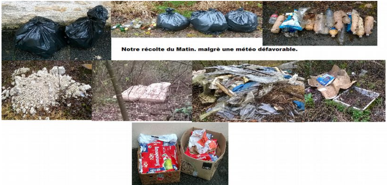
Notre récolte du Matin. malgré une météo défavorable.

Merci aux bénévoles qui ont bravé la météo défavorable pour participer à cette sortie nature propre le samedi .